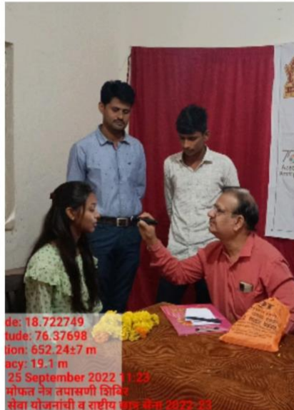
Latitude: 18.722749 Longitude: 76.37698 Altitude: 552.24±7 m Accuracy: 19.1 m Time: 25 September 2022 11:23 Note: मोफत नेत्र तपासणी शिबिर राष्ट्रीय सेवा योजनांची व राष्ट्रीय सेवा सत्र 2022-23