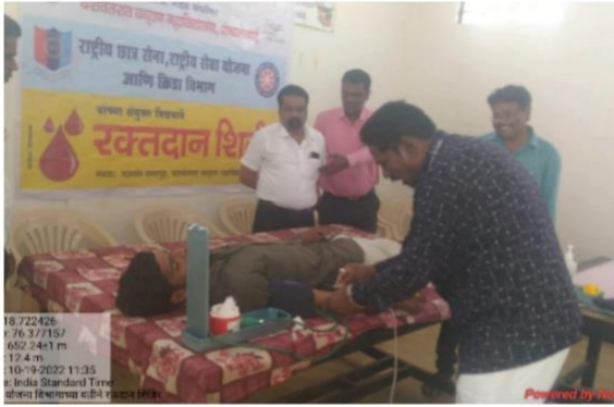
18.722426 F.76.377216 682.24x1 m 12.4 m 10-9-2022 11:35 © India Standard Time यशवंत विभागच्या वतीने रक्तदान शिबिर