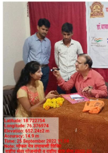
Latitude: 18.722754 Longitude: 76.376974 Altitude: 652.24±2 m Accuracy: 14.9 m Time: 25 September 2022 11:24 Note: मोफत नेत्र तपासणी शिबिर राष्ट्रीय सेवा योजनांची व राष्ट्रीय सेवा सत्र 2022-23