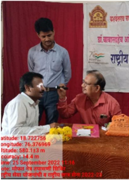
Latitude: 18.722756 Longitude: 76.376969 Altitude: 580.1±3 m Accuracy: 14.4 m Time: 25 September 2022 11:16 Note: मोफत नेत्र तपासणी शिबिर राष्ट्रीय सेवा योजनांची व राष्ट्रीय सेवा सत्र 2022-23