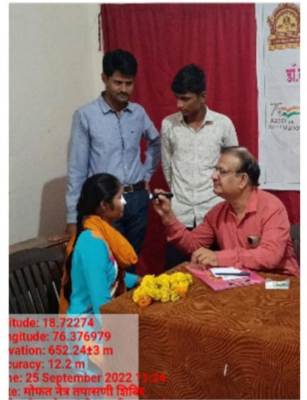
Latitude: 18.72274 Longitude: 76.376979 Altitude: 652.24±3 m Accuracy: 12.2 m Time: 25 September 2022 11:24 Note: मोफत नेत्र तपासणी शिबिर