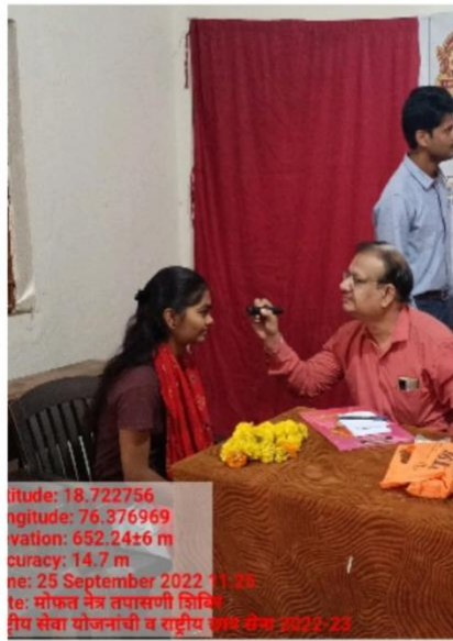
Latitude: 18.722756 Longitude: 76.376969 Altitude: 652.24±6 m Accuracy: 14.7 m Time: 25 September 2022 11:25 Note: मोफत नेत्र तपासणी शिबिर राष्ट्रीय सेवा योजनांची व राष्ट्रीय सेवा सत्र 2022-23