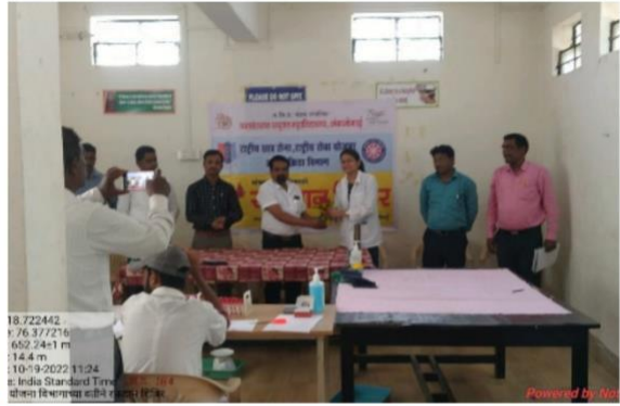
18.722442 F.76.377216 682.24x1 m 14.4 m 10-9-2022 11:24 © India Standard Time यशवंत विभागच्या वतीने रक्तदान शिबिर