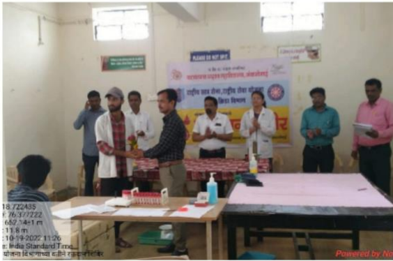
18.722435 F.76.377222 682.24x1 m 11.8 m 10-9-2022 11:29 © India Standard Time यशवंत विभागच्या वतीने रक्तदान शिबिर